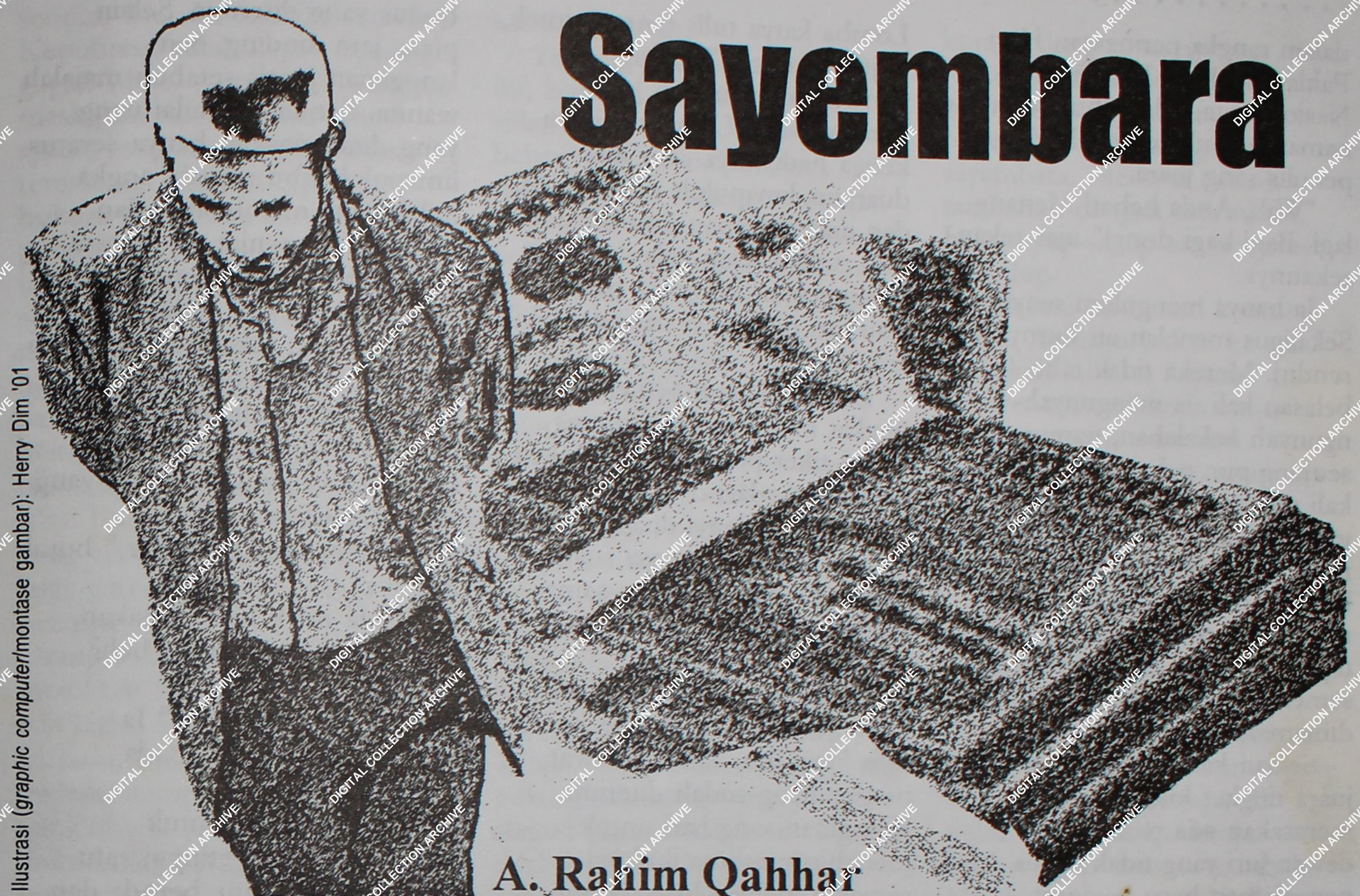
Ilustrasi (graphic computer/montase gambar): Hery Dim '01